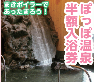
疲れた体を癒すのにぜひご利用ください。