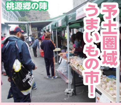
おながが空いたら予土圏域のうまいものを堪能しよう！