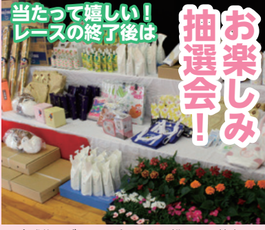
開会式後にゼッケン番号による松野町の特産品をはじめとした楽しい賞品が当たる大抽選会です。